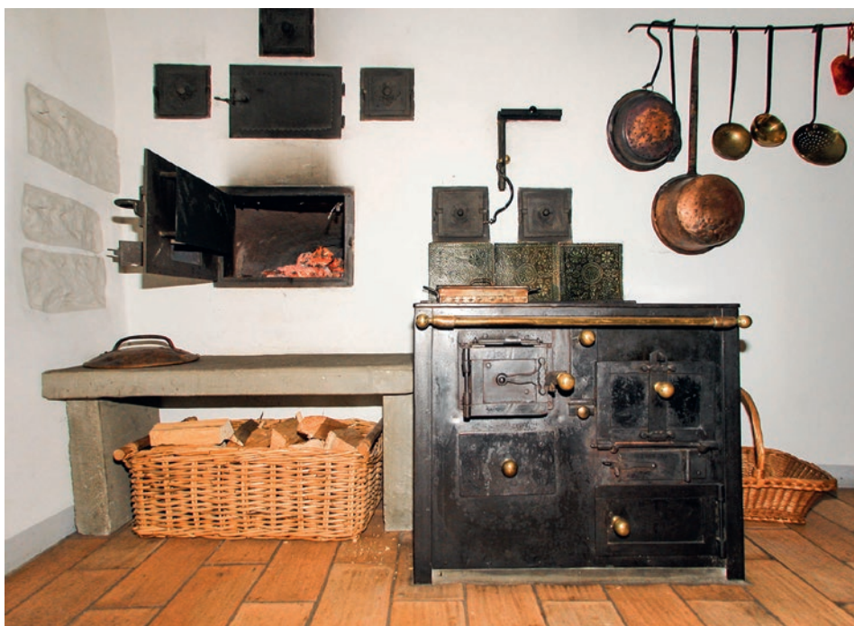
Nicht nur der Kochherd hat sich im Laufe der Zeit verändert, sondern das ganze Küchendesign.