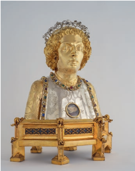
Büstenreliquiar des heiligen Plazidus, um 1480.

mittelalterlichen Ausstattung der Kathedrale Mariae Himmelfahrt und der Klosterkirche St. Luzi. Sie illustrieren