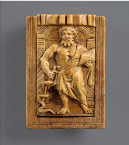
Römisches Arzneikästchen aus Elfenbein. Schiebedeckel mit Relief des Gottes Aeskulap. Zweitverwendung als Reliquiar, um 400.

Die malerische Altstadt von Chur, der ältesten Stadt der Schweiz, bezaubert Besucher. Wobei die Kathedrale St. Mariae Himmelfahrt, die oberhalb der Altstadt auf einem Felsrücken thront, zu den Sehenswürdigkeiten zählt. Gemeinsam mit dem Bischöflichen Schloss begrenzt sie bergseitig den Bischöflichen Hof. Das spätromantische Bauwerk gehört zu den Kulturdenkmälern von nationaler Bedeutung und wurde 1272, nach hundertjähriger Bauzeit, eingeweiht. Das denkmalgeschützte Gebäude repräsentiert nicht nur die Bischofsresidenz des Churer Diözesanbischofs sowie den Amtssitz des bischöflichen Officialats und der bischöflichen Kanzlei, sondern beherbergt auch ein