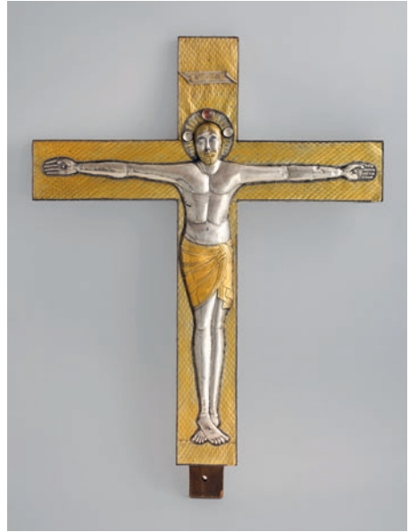
Triumphkreuz. Vermutlich 13. Jh.