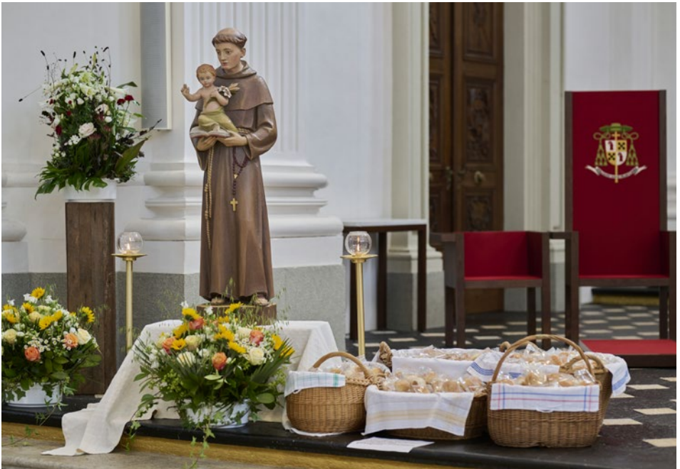
Statue des heiligen Antonius von Padua, zu dessen Füßen die Antoniusbrötchen lagern.