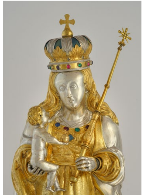
Halbfigur der Mutter Gottes. Um 1600 entstanden.

öffentlich zugängliches Kleinod, das Domschatzmuseum. «Wir stellen zwei Objektgruppen aus und zeigen neben dem eigentlichen Domschatz den Wandbildzyklus der Totenbilder von 1543», erklärt Kuratorin Anna Barbara Müller. Die Leiterin des Domschatzmuseums arbeitet im Auftrag des Trägervereins, der Kathedralstiftung des Diözese Chur, und präsidiert die Betriebskommission des Museums. Das zu Beginn der Vierzigerjahre in der unteren Sakristei eingerichtete Domschatzmuseum wurde aufgrund der Restaurierungsarbeiten im Jahre 2002 geschlossen und der Dom-