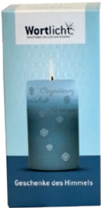
Geschenke des Himmels, Blau