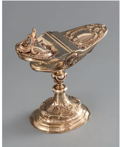
Rokoko-Weihrauchschiffchen, um 1779/81.