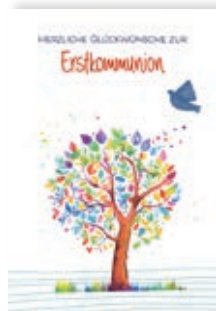
Herzliche Glückwünsche zur Erstkommunion