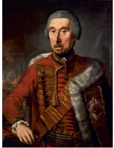
Hans Joachim von Zieten 1780, nach einem Gemälde von Heinrich Franke.

Da erhob sich Zieten, verbeugte sich tief vor dem König und sprach mit lauter, fester Stimme: «Euere königliche Hoheit wissen, dass ich im Krieg keine Gefahr gefürchtet, und überall, wo es darauf ankam,