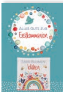
Glückwunschkarte mit Blumensamen