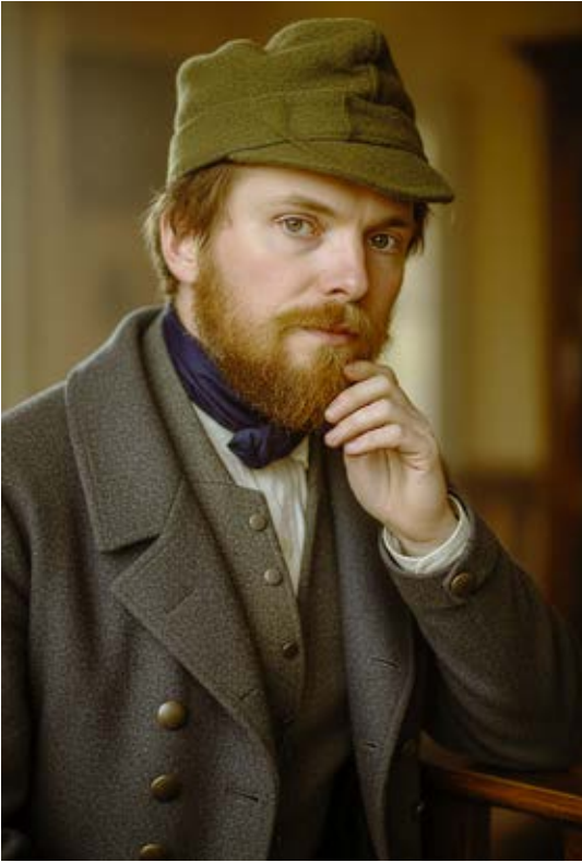
Selbstbildnis um 1840, mittels KI anhand einer Skizze des Künstlers interpretiert und koloriert.

ein vitaler Baum, an dem Menschen nach oben gelangen. In der unteren Mitte, im Halbdunkel, sehen wir die Arche Noah und darüber den Regenbogen, mit welchem der erste Bund von Gott mit den Menschen nach dem Ende der Sintflut angesprochen wird (Gen 6,1–9,17).