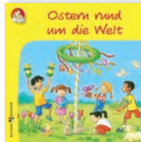
Mein Mitmachbuch zu Ostern